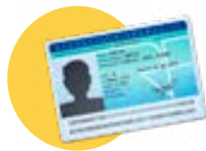
● Votre pièce d'identité