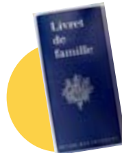
● Le livret de famille (en cas de prise en charge de votre enfant)

Ce livret vous présente de façon chronologique toutes les étapes du parcours de soins au sein de notre établissement. Nous vous remercions d'en prendre connaissance et de le conserver avec vous. Vous trouverez à la fin de ce livret un rabat au sein duquel vous pourrez intégrer les documents qui vous sont remis. Vous trouverez d'ores et déjà intégrés à ce livret en annexe :