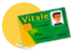
● Votre carte vitale