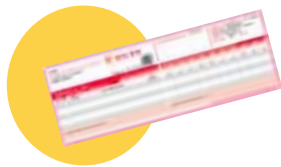
● Votre carte de mutuelle