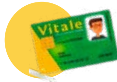
● Votre carte vitale