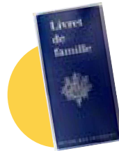
● Le livret de famille (en cas de prise en charge de votre enfant)

Ce livret vous présente de façon chronologique toutes les étapes du parcours de soins au sein de notre établissement. Nous vous remercions d'en prendre connaissance et de le conserver avec vous. Vous trouverez à la fin de ce livret un rabat au sein duquel vous pourrez intégrer les documents qui vous sont remis. Vous trouverez d'ores et déjà intégrés à ce livret en annexe :