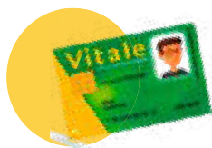
● Votre carte vitale