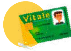
● Votre carte vitale