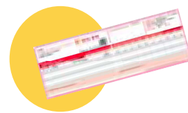
● Votre carte de mutuelle