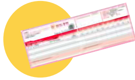
● Votre carte de mutuelle