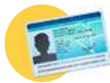
● Votre pièce d'identité