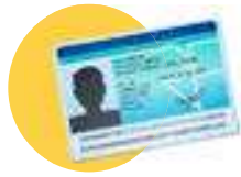
● Votre pièce d'identité